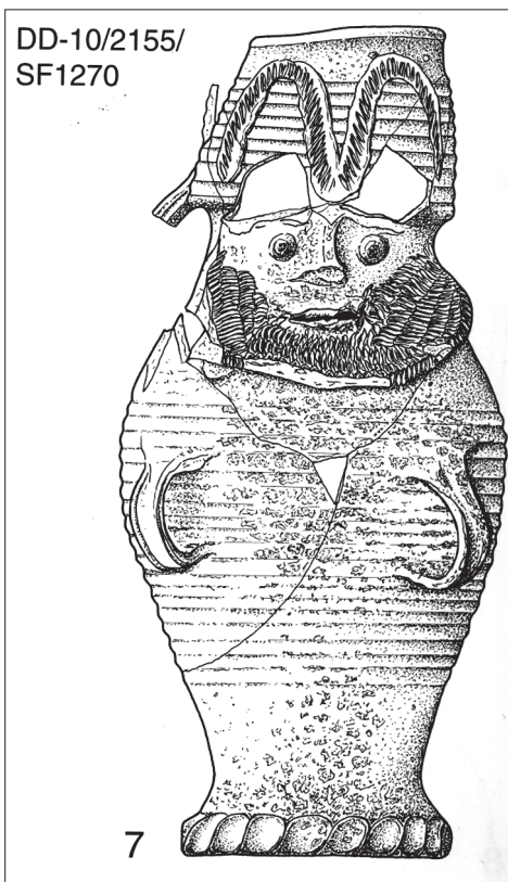
Obr. 3. Drážďany. Ukázka tzv. džbánu s vousatým obličejem.

Inv. č. A 435 – Horní část nádoby, nejspíše menšího džbánu. Okraj rovný, zakulacený, pod ním lišta kolmo přesekávaná. Níže široko umístěné kolky se čtyřmi perličkami. Kamenina, povrch hnědé barvy, vně solná glazura.